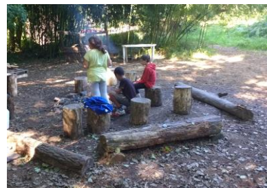
Colonie de vacances