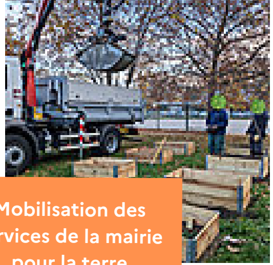
Mobilisation des services de la mairie pour la terre