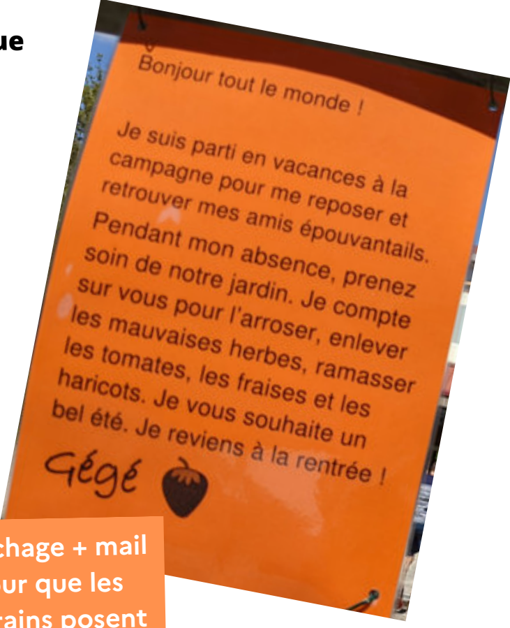
Affichage + mail pour que les riverains posent des questions