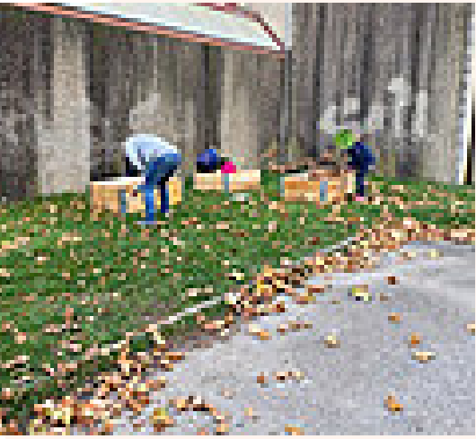
Mobilisation des parents pour la construction des bacs